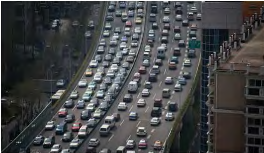
A Shanghai, en Chine, en 2015.

LE MONDE | 06.07.2016 à 12h34 • Mis à jour le 06.07.2016 à 14h41 | Par Éric Béziat