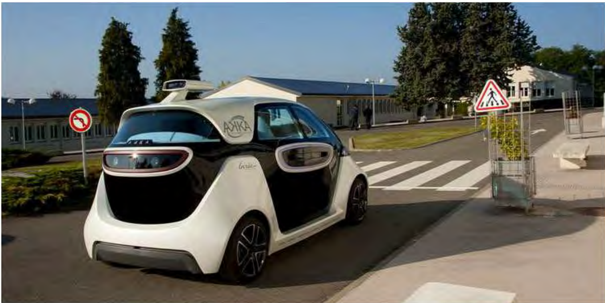
Link&Go, véhicule électrique intelligent bi-mode pouvant se conduire et se garer avec ou sans conducteur, fruit de la collaboration Inria - AKKA Technologies.

Au moment de la COP21, on peut se demander à juste titre quelle sera la place de la voiture dans la ville du futur. On voit en effet se multiplier les annonces sur la réduction de l'espace pour circuler, la suppression de places de parking, les péages urbains, l'interdiction des 4x4, etc. Pourquoi tant d'animosité envers ce merveilleux outil de liberté que chacun désire dès son plus jeune âge ?