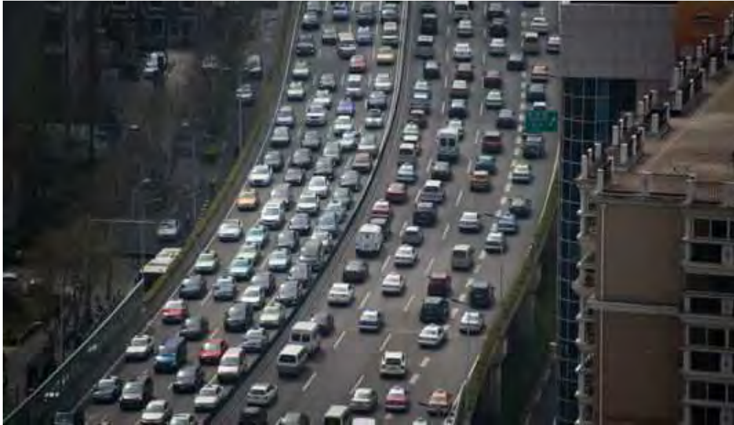
A Shanghai, en Chine, en 2015.

LE MONDE | 06.07.2016 à 12h34 • Mis à jour le 06.07.2016 à 14h41 | Par Éric Béziat