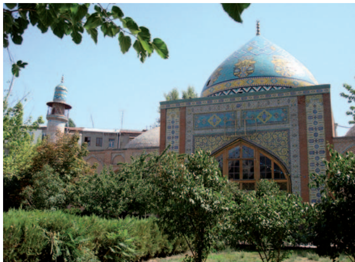
La mosquée Bleue (Gök Jami) de Erevan a été construite au XVIII e siècle alors que la ville était sous domination perse. Sa restauration à la fin des années 1990, financée par des fonds iraniens, symbolise les bonnes relations qui existent entre l’Arménie et l’Iran.

Dernière puissance tutélaire dans la région, la Russie n’a pas de stratégie sud-caucasienne à long terme, en dehors d’une politique classique d’intégration à partir de trois principes : absorption de l’Arménie, son alliée au sein de l’Organisation du traité de sécurité collective (OTSC), bras armé de la Communauté des États indépendants (CEI) ; déstabilisation de la Géorgie ; intimidation à l’égard de l’Azerbaïdjan. Membre comme la Turquie et l’Iran de l’Organisation de la conférence islamique (OCI), la Russie a trouvé chez ces deux acteurs de poids les moyens de réduire ses incohérences régionales. Les Turcs et les Iraniens, aux intérêts tantôt spécifiques tantôt convergents avec la Russie, voient leur prestige renforcé par l’attention que Moscou leur porte et se disent ouverts à l’idée du partenariat renforcé avec la Russie.