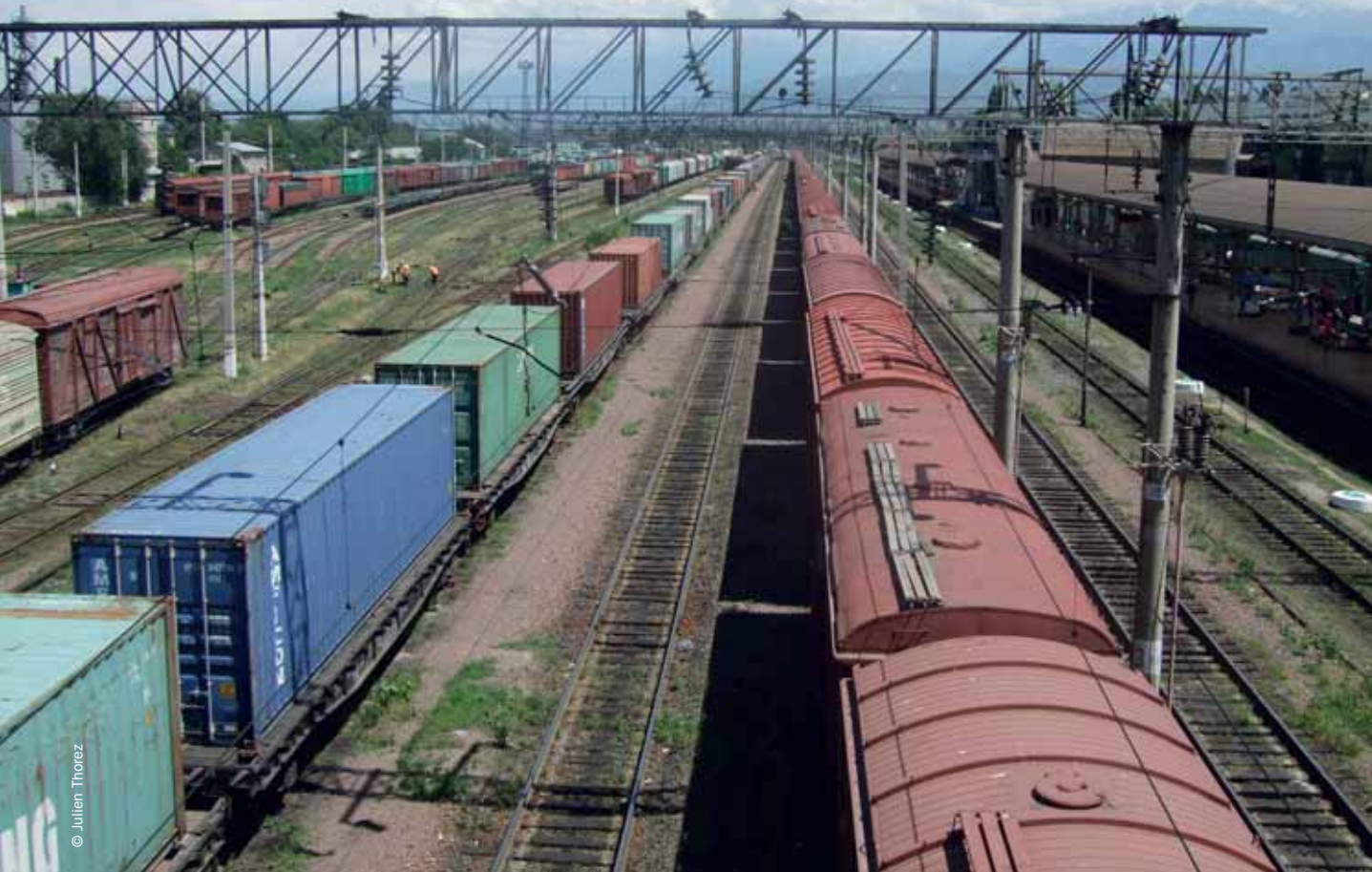
Trains de marchandises en gare d'Almaty 1, Kazakhstan, juillet 2013.

ment, entre la Chine et l'Iran. En 2015, environ 1 250 convois ont ainsi relié la Chine et l'Europe via le Kazakhstan, parmi lesquels un train qui assure régulièrement depuis 2011 le transport de marchandises à haute valeur ajoutée (produits informatiques, etc.) entre Chongqing et Duisbourg.