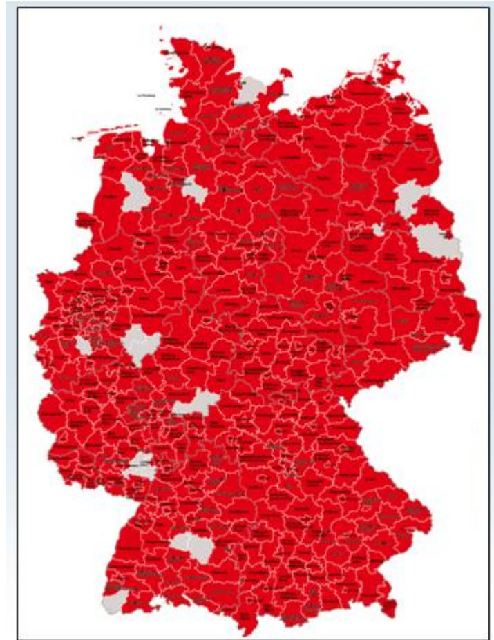
Graphique 3 : Zones géographiques couvertes par le programme Perspective 50plus au 1 er janvier 2011